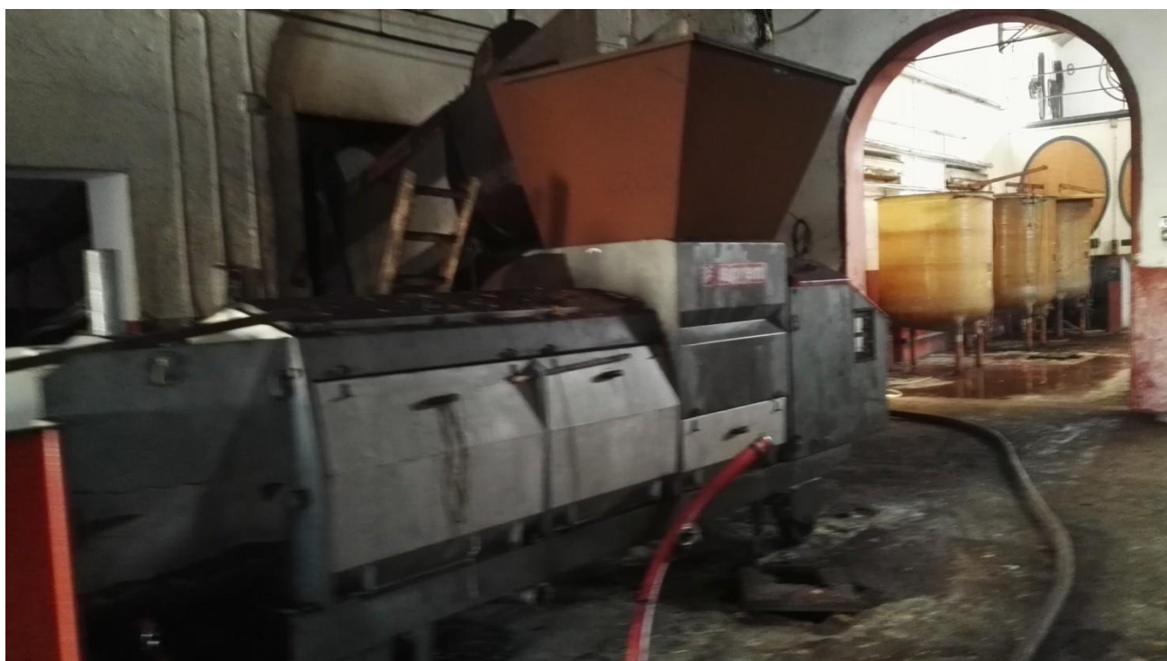
torchi Siprem e veloci presse