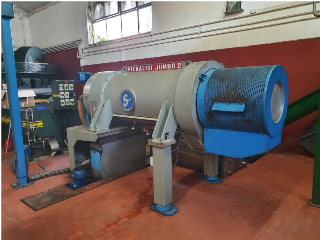
estrattore centrifugo con vaschetta vibro filtro con tramoggia di scarico Pieralisi