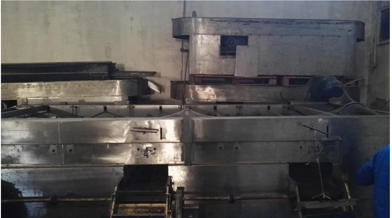
linea completa invasettamento con pastorizzatore