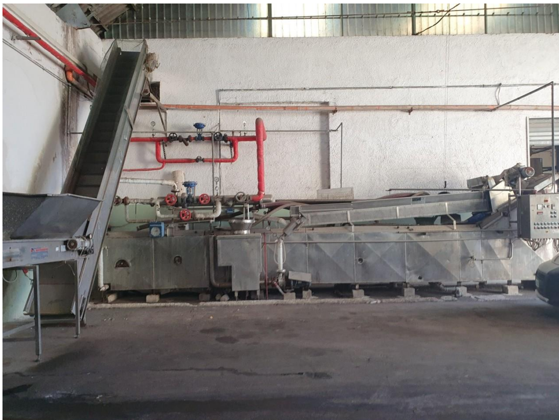
cuocitore in continuo in monoblocco