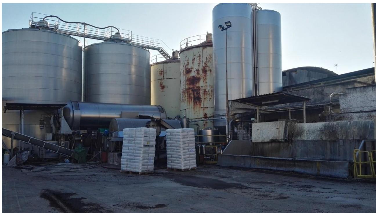
I silos in acciaio con due silos in ferro (bianchi)