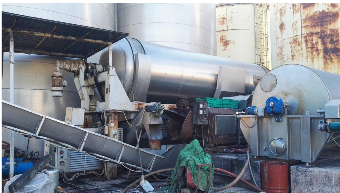
pressa pneumatica con accessori marca Velo