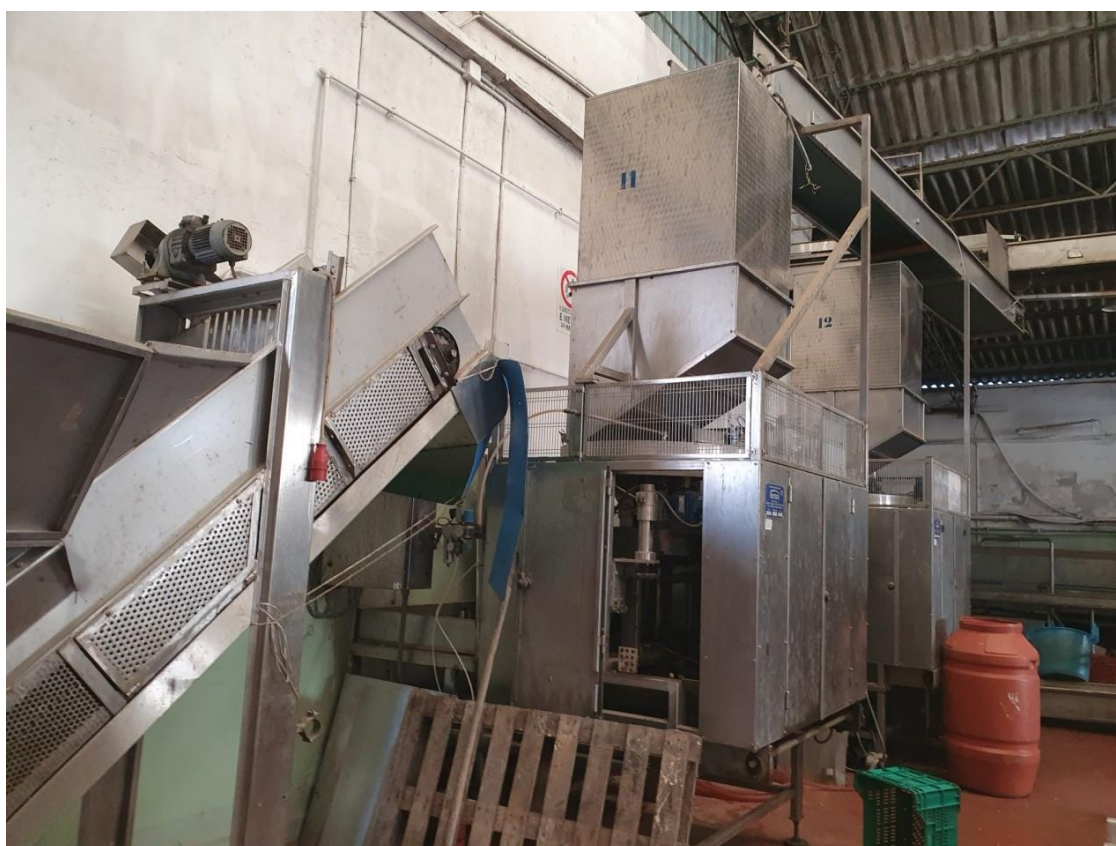
defogliatrici - tornitrici per carciofi