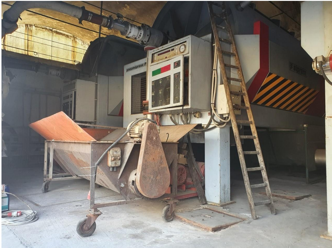
pneumopresse mod. P250