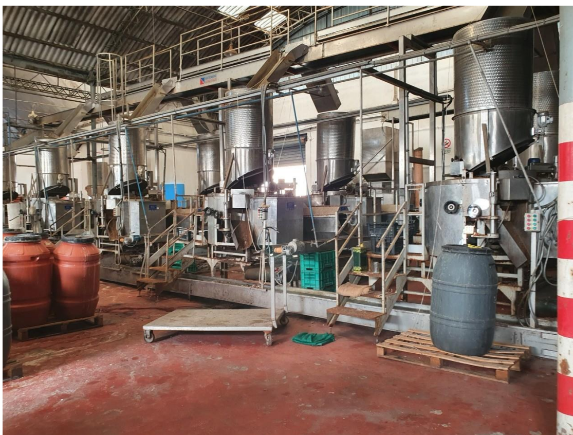
defogliatrici per carciofini