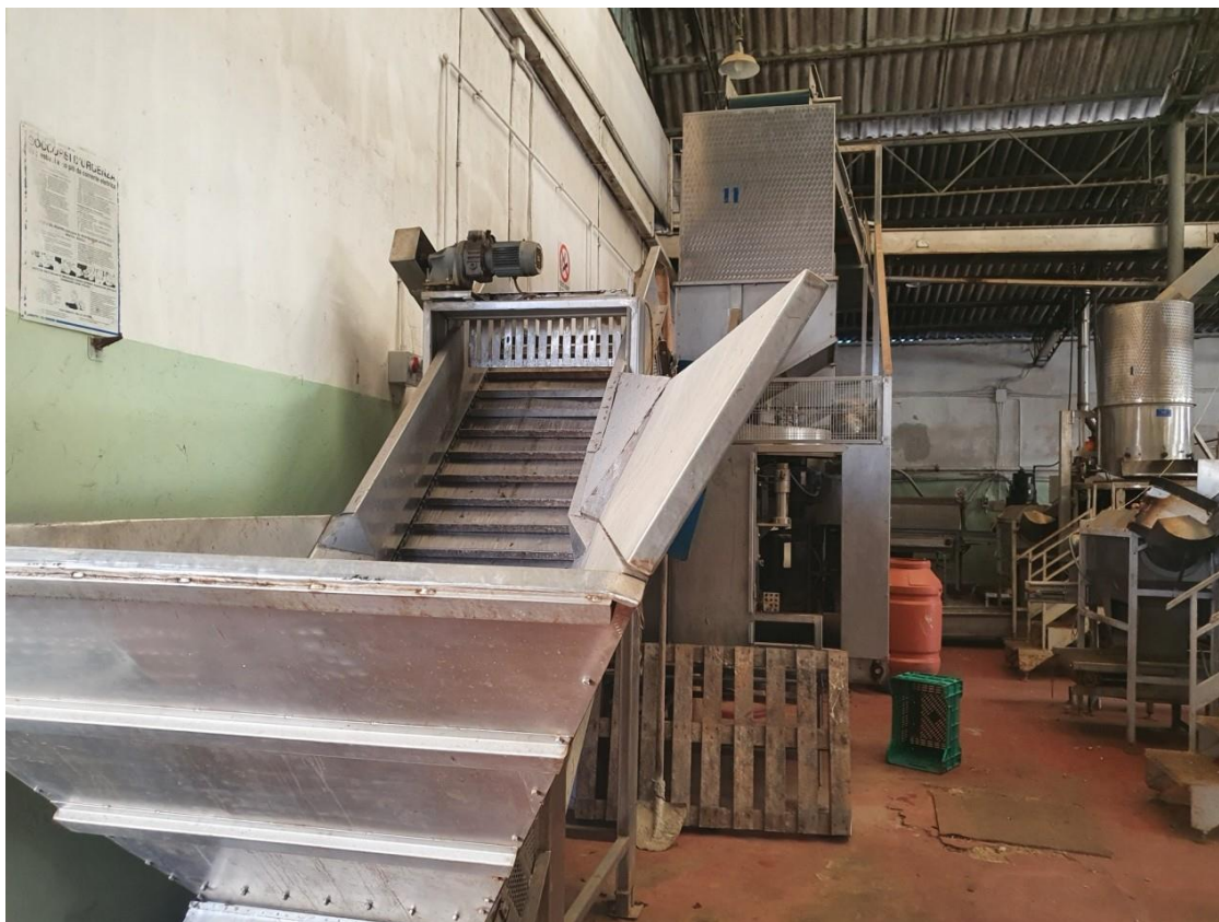
cuocitore in continuo in monoblocco